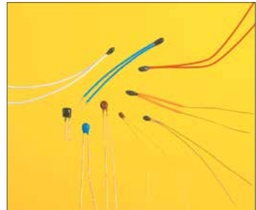
Coated Chip Style