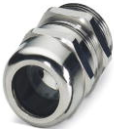
Cable gland, Cable gland material: Brass, nickel-plated, External cable diameter 10 mm ... 14 mm, Shielding: Yes, Connecting thread: Pg16, Color: silver

Please be informed that the data shown in this PDF Document is generated from our Online Catalog. Please find the complete data in the user's documentation. Our General Terms of Use for Downloads are valid ( http://phoenixcontact.com/download )