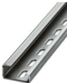
G-profile DIN rail, material: Steel, perforated, height 15 mm, width 32 mm, length 2 m

Please be informed that the data shown in this PDF Document is generated from our Online Catalog. Please find the complete data in the user's documentation. Our General Terms of Use for Downloads are valid ( http://download.phoenixcontact.com )