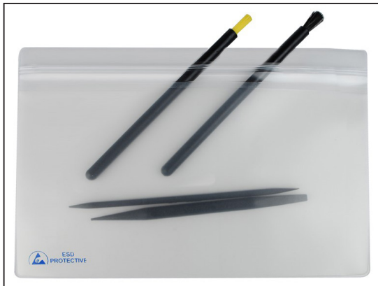
34458 with brush tools and probes (not included)

"It should be understood that any object, item, material or person could be a source of static electricity in the work environment. Removal of unnecessary nonconductors, replacing nonconductive materials with dissipative or conductive materials and grounding all conductors are the principle methods of controlling static electricity in the workplace, regardless of the activity." [ESD Handbook ESD TR20.20-2008 section 2.4 Sources of Static Electricity]