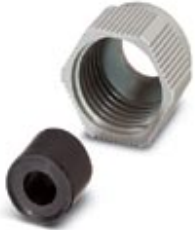
D-SUB cap nut with line seal, for sleeve housing VS-09-..., conductor diameter of 5 mm ... 9 mm

Please be informed that the data shown in this PDF Document is generated from our Online Catalog. Please find the complete data in the user's documentation. Our General Terms of Use for Downloads are valid ( http://download.phoenixcontact.com )