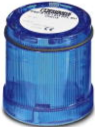
LED random flashing beacon element, 24 V DC, blue

Please be informed that the data shown in this PDF Document is generated from our Online Catalog. Please find the complete data in the user's documentation. Our General Terms of Use for Downloads are valid ( http://phoenixcontact.com/download )