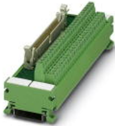
VARIOFACE module, with screw connection and flat-ribbon cable connector, for assembly on NS 35/7.5, 10 positions

Please be informed that the data shown in this PDF Document is generated from our Online Catalog. Please find the complete data in the user's documentation. Our General Terms of Use for Downloads are valid ( http://phoenixcontact.com/download )