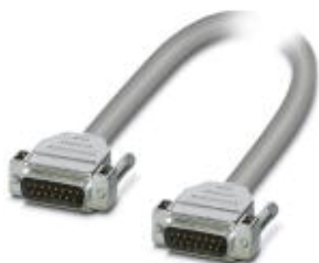
Assembled, shielded round cable, with two 15-pos. D-SUB pin strips (1:1 connection), cable length: 7.20 m

Please be informed that the data shown in this PDF Document is generated from our Online Catalog. Please find the complete data in the user's documentation. Our General Terms of Use for Downloads are valid ( http://phoenixcontact.com/download )