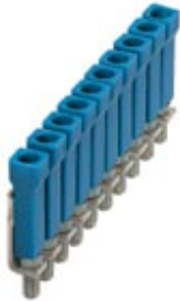
Jumper, Number of positions: 10, Color: blue

Please be informed that the data shown in this PDF Document is generated from our Online Catalog. Please find the complete data in the user's documentation. Our General Terms of Use for Downloads are valid ( http://download.phoenixcontact.com )