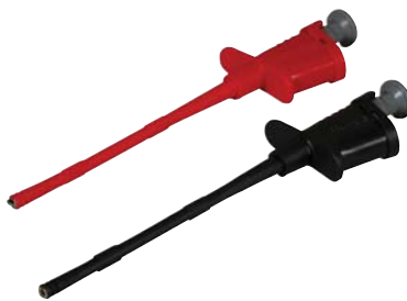
CT2489 (see model numbers above)

Copyright © 2007, Cal Test Electronics, Inc. All rights reserved. Information in this publication supersedes that in all previously published material. Trade names referenced are the service marks, trademarks or registered trademarks of their respective companies.