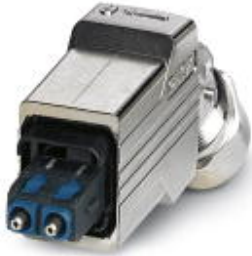
Push-pull connector (version 14), die-cast zinc, with SC-RJ insert for POF, for cable diameter of 5.5 mm ... 10 mm, cable outlet at the bottom

Please be informed that the data shown in this PDF Document is generated from our Online Catalog. Please find the complete data in the user's documentation. Our General Terms of Use for Downloads are valid ( http://phoenixcontact.com/download )