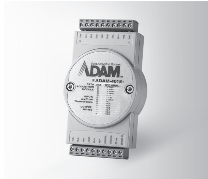
ADAM-4018+ FCC CE RoHS LISTED E190861 ETC.