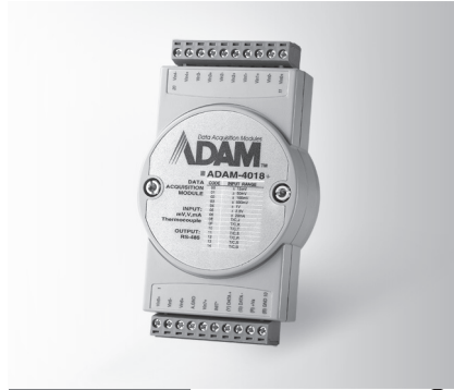
ADAM-4018+ FCC CE RoHS LISTED E190861 E.T.C.