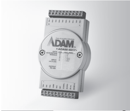
ADAM-4017+ FCC CE RoHS LISTED E190861 E.T.C.

8-ch Analog Input Module with Modbus 8-ch Thermocouple Input Module with Modbus 8-ch Universal Analog Input Module with Modbus