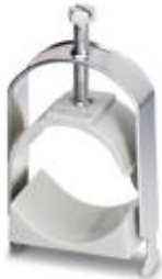
Cable clamp, for DIN rails

Please be informed that the data shown in this PDF Document is generated from our Online Catalog. Please find the complete data in the user's documentation. Our General Terms of Use for Downloads are valid ( http://download.phoenixcontact.com )