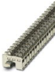
Power terminal block, Connection method Screw connection, Load current : 125 A, Cross section: 0.75 mm 2 - 35 mm 2 , Width: 12 mm, Color: aluminum

Please be informed that the data shown in this PDF Document is generated from our Online Catalog. Please find the complete data in the user's documentation. Our General Terms of Use for Downloads are valid ( http://download.phoenixcontact.com )