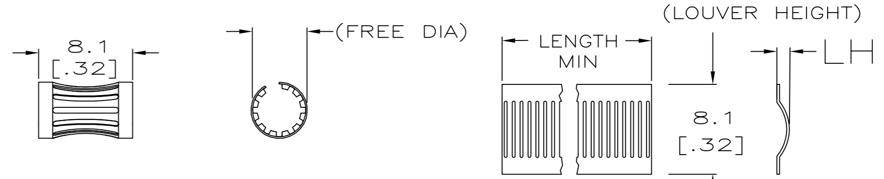
STYLE A (FEMALE)