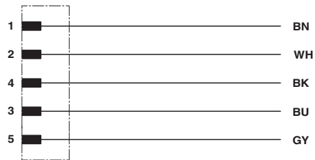
Contact assignment of the M12 plug