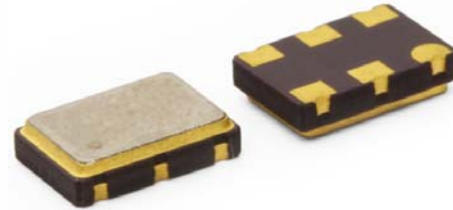
Part Dimensions: 7.0 × 5.0 × 2.0mm • 178.462mg