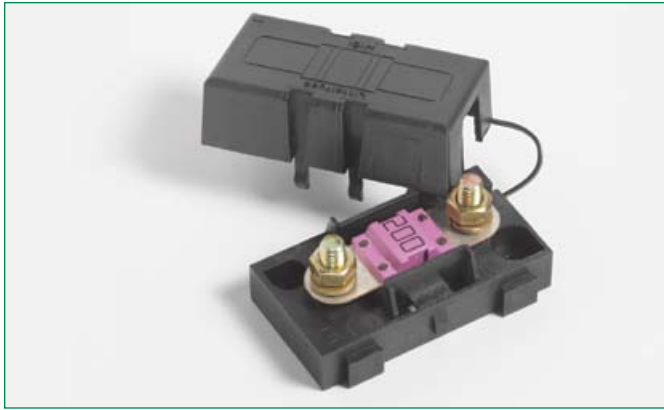
Dimensions in mm / Maße in mm