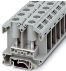
Universal terminal block with bolt connection, cross section: 1 - 25 mm 2 , width: 18 mm, color: gray

Please be informed that the data shown in this PDF Document is generated from our Online Catalog. Please find the complete data in the user's documentation. Our General Terms of Use for Downloads are valid ( http://download.phoenixcontact.com )