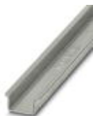
DIN rail, material: Steel, unperforated, 2.3 mm thick, height 15 mm, width 35 mm, length: 2 m

DIN rail - NS 35/15-2,3 UNPERF 2000MM - 1201798