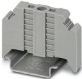
End clamp, width: 9.5 mm, color: gray

Please be informed that the data shown in this PDF Document is generated from our Online Catalog. Please find the complete data in the user's documentation. Our General Terms of Use for Downloads are valid ( http://download.phoenixcontact.com )