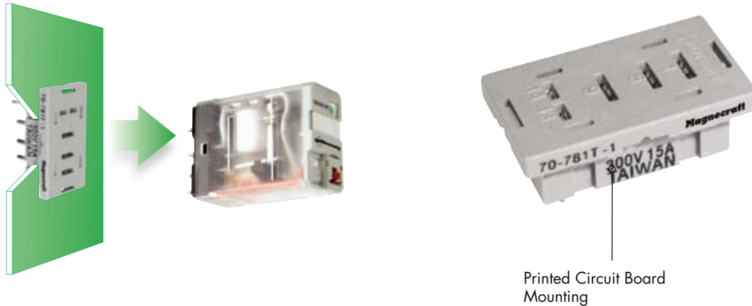
Printed Circuit Board Mounting

BOLD-FACED PART NUMBERS ARE NORMALLY STOCKED