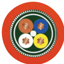
Sercos III [93K]