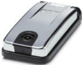
Mounting frame for one front plate/socket, frame: black, cover: metallic, closed with 3 mm two-way key bit.

Please be informed that the data shown in this PDF Document is generated from our Online Catalog. Please find the complete data in the user's documentation. Our General Terms of Use for Downloads are valid ( http://phoenixcontact.com/download )