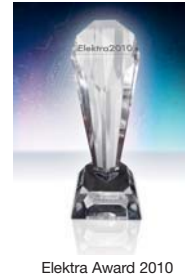
Elektra Award 2010