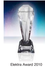
Elektra Award 2010