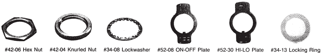
#42-06 Hex Nut #42-04 Knurled Nut #34-08 Lockwasher #52-08 ON-OFF Plate #52-30 HI-LO Plate #34-13 Locking Ring