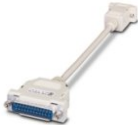
Adapter cable, 9-pos. D-SUB socket to 25-pos. D-SUB male

Please be informed that the data shown in this PDF Document is generated from our Online Catalog. Please find the complete data in the user's documentation. Our General Terms of Use for Downloads are valid ( http://phoenixcontact.com/download )