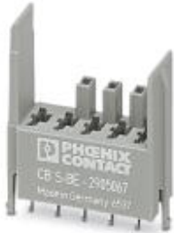
Solder base element for PCB mounting for accommodating CB TM... or CB E... device circuit breakers

Please be informed that the data shown in this PDF Document is generated from our Online Catalog. Please find the complete data in the user's documentation. Our General Terms of Use for Downloads are valid ( http://phoenixcontact.com/download )