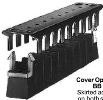
Cover Options BB Skirted access on both sides.