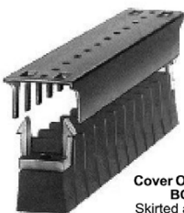
Cover Options BO Skirted access on one side only.