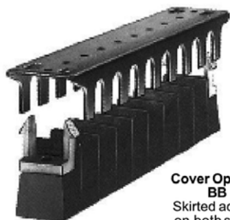
Cover Options BB Skirted access on both sides.