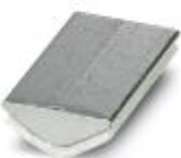
Insertion profile, Color: silver