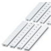
Zack marker strip, white, For terminal block width: 10 mm

Zack marker strip - ZB10:SO/CMS - 1050525