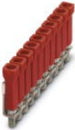
Jumper, Number of positions: 10, Color: red

Please be informed that the data shown in this PDF Document is generated from our Online Catalog. Please find the complete data in the user's documentation. Our General Terms of Use for Downloads are valid ( http://phoenixcontact.com/download )