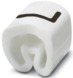
Conductor marking collar, labeled with the capital letter: Letters, white, width: 3.2 mm

Please be informed that the data shown in this PDF Document is generated from our Online Catalog. Please find the complete data in the user's documentation. Our General Terms of Use for Downloads are valid ( http://phoenixcontact.com/download )