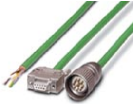
Remote bus cable, 3 m, D-SUB 9 PIN male plug and D-SUB 9 SOCKET female plug

Please be informed that the data shown in this PDF Document is generated from our Online Catalog. Please find the complete data in the user's documentation. Our General Terms of Use for Downloads are valid ( http://phoenixcontact.com/download )