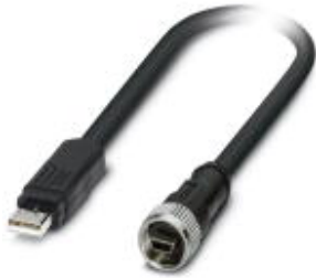
Assembled USB cable, shielded, color: black, PVC outer sheath, USB mini-B/IP20 on USB type A/IP20, length: 5 m

Please be informed that the data shown in this PDF Document is generated from our Online Catalog. Please find the complete data in the user's documentation. Our General Terms of Use for Downloads are valid ( http://download.phoenixcontact.com )