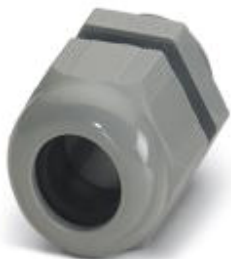
Cable gland, Cable gland material: Polyamide 6, External cable diameter 3 mm ... 6.5 mm, Shielding: No, Connecting thread: M12, Color: silver grey

Please be informed that the data shown in this PDF Document is generated from our Online Catalog. Please find the complete data in the user's documentation. Our General Terms of Use for Downloads are valid ( http://phoenixcontact.com/download )