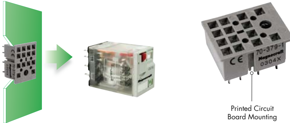
Printed Circuit Board Mounting