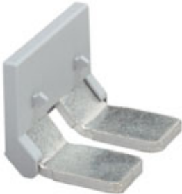
Insertion bridge, Number of positions: 2, Color: gray

Please be informed that the data shown in this PDF Document is generated from our Online Catalog. Please find the complete data in the user's documentation. Our General Terms of Use for Downloads are valid ( http://phoenixcontact.com/download )