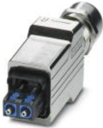
Push-pull connector (version 14), die-cast zinc, with SC-RJ insert for POF, for cable diameter of 5.5 mm ... 10 mm, cable outlet at the bottom

Please be informed that the data shown in this PDF Document is generated from our Online Catalog. Please find the complete data in the user's documentation. Our General Terms of Use for Downloads are valid ( http://phoenixcontact.com/download )