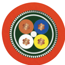
Sercos III [93K]