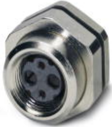
Fiber optics coupling M12, duplex, suitable for all fibers, with wall bracket, IP65 degree of protection

Please be informed that the data shown in this PDF Document is generated from our Online Catalog. Please find the complete data in the user's documentation. Our General Terms of Use for Downloads are valid ( http://phoenixcontact.com/download )