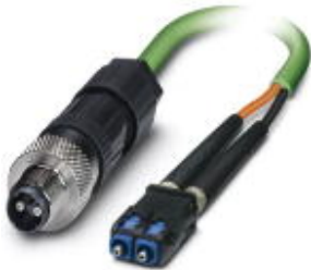
Assembled FO cable, round cable, 980/1000 µm POF fiber, M12 fiber optic connector to SC-RJ/IP20

Please be informed that the data shown in this PDF Document is generated from our Online Catalog. Please find the complete data in the user's documentation. Our General Terms of Use for Downloads are valid ( http://phoenixcontact.com/download )