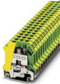
Ground terminal block with screw connection, cross section: 0.5 - 6 mm 2 , AWG: 20 - 8, width: 8.2 mm, color: green-yellow

Please be informed that the data shown in this PDF Document is generated from our Online Catalog. Please find the complete data in the user's documentation. Our General Terms of Use for Downloads are valid ( http://download.phoenixcontact.com )