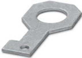
Plate for fixing the FLT-ISG-100-EX isolating spark gap to a flange, drill hole diameter of 39 mm.

Please be informed that the data shown in this PDF Document is generated from our Online Catalog. Please find the complete data in the user's documentation. Our General Terms of Use for Downloads are valid ( http://phoenixcontact.com/download )