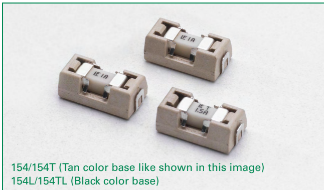
154/154T (Tan color base like shown in this image) 154L/154TL (Black color base)