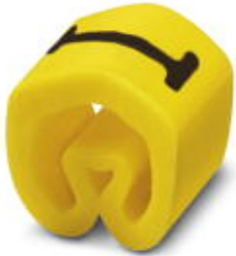
Conductor marking collar, labeled with the capital letter: Letters, yellow, width: 3.2 mm

Please be informed that the data shown in this PDF Document is generated from our Online Catalog. Please find the complete data in the user's documentation. Our General Terms of Use for Downloads are valid ( http://phoenixcontact.com/download )