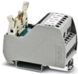
VARIOfACE Professional (VIP) board for the ROC800 controller

Please be informed that the data shown in this PDF Document is generated from our Online Catalog. Please find the complete data in the user's documentation. Our General Terms of Use for Downloads are valid ( http://phoenixcontact.com/download )