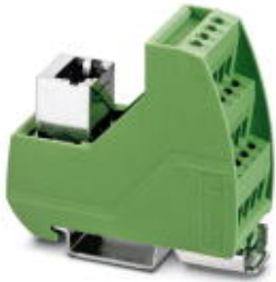
VARIOFACE module with screw connection and RJ45 connector

Please be informed that the data shown in this PDF Document is generated from our Online Catalog. Please find the complete data in the user's documentation. Our General Terms of Use for Downloads are valid ( http://phoenixcontact.com/download )