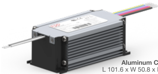
Aluminum Case L 101.6 x W 50.8 x H 38.5 mm (L 4 x W 2 x H 1.52 in)