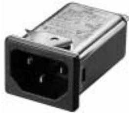
NG3QM (Optional wire type)