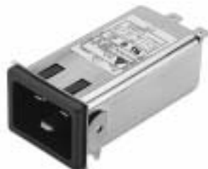
20GENG3E (Optional wire type)