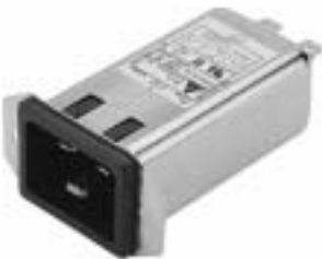
20GEEG3E (Optional wire type)